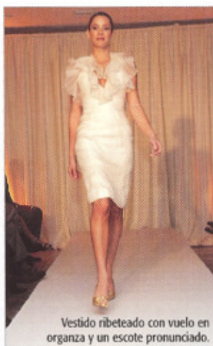
Vestido ribeteado con vuelo en organza y un escote pronunciado.