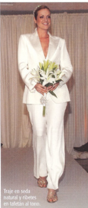
Traje en seda natural y ribetes en tafetán al tono.