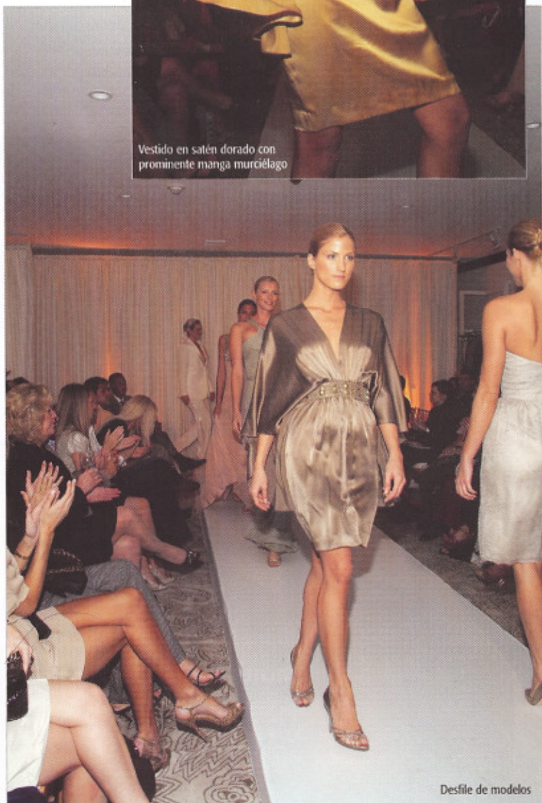
Desfile de modelos