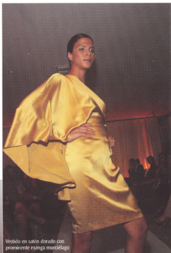
Vestido en satén dorado con prominente manga murciélago

Por Nancy Clara, editora de Target Style.